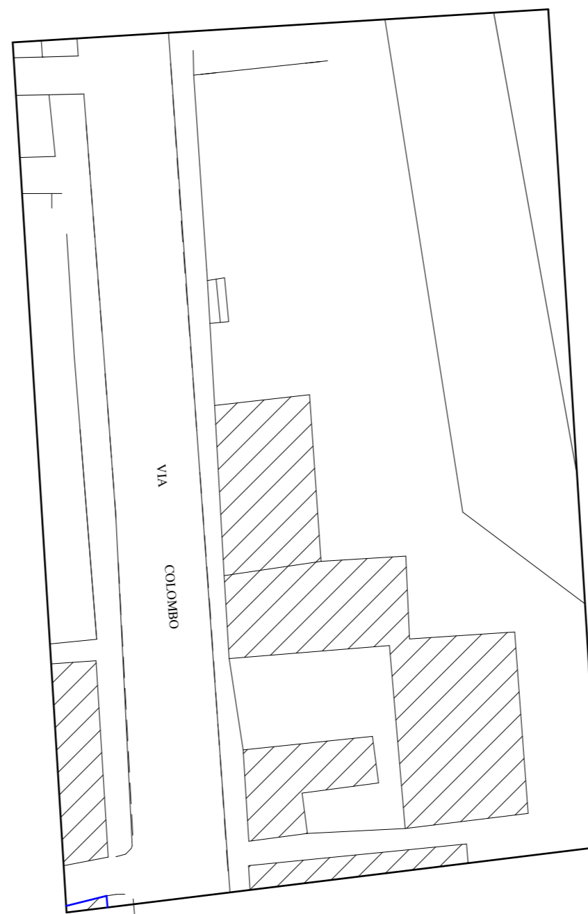
STRALCIO AEROFOTOGRAMMETRICO 1:500