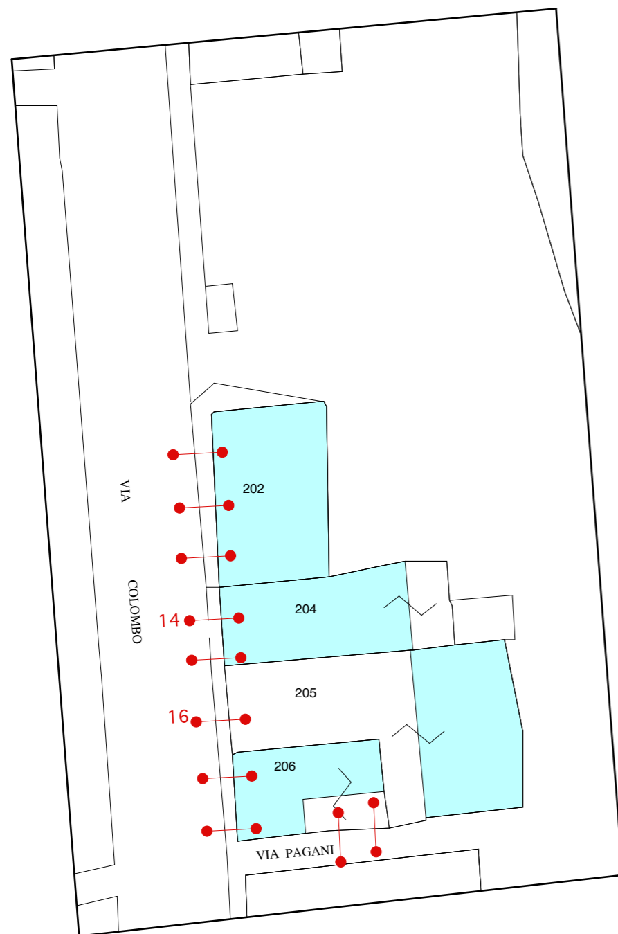
STRALCIO CATASTALE 1:500